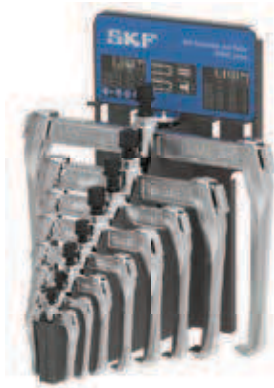
TMMR 8F/ KÉSZLET