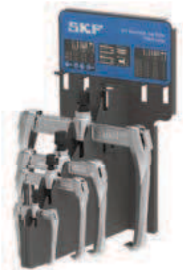
TMMR 4F/ KÉSZLET