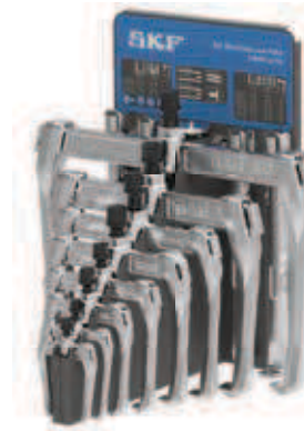
TMMR 8XL/ KÉSZLET